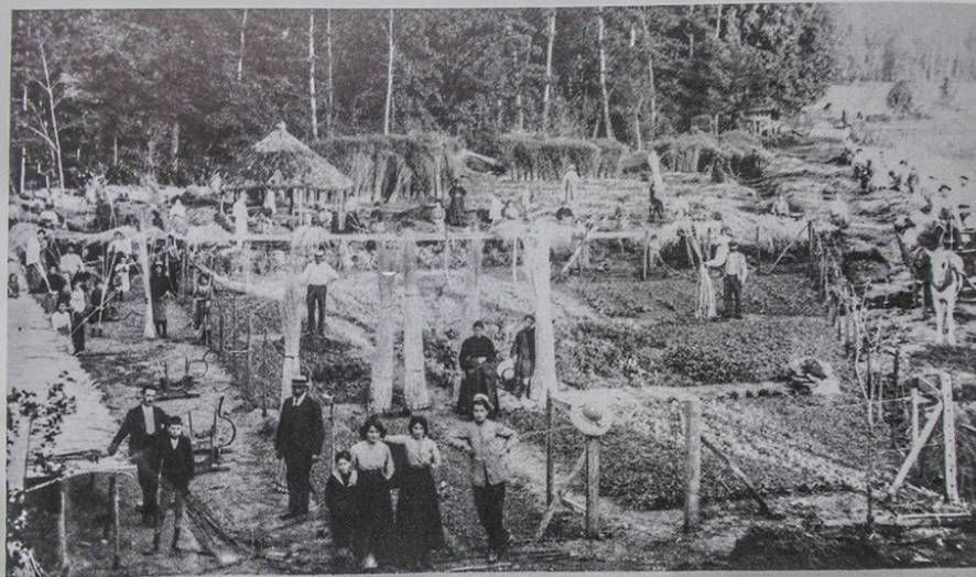
OBJAT (Corrèze) Fabrique de Vannerie — PEYRAMAURE Frères DECORTICAGE DE L'OSIER